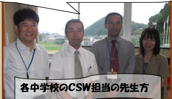
各中学校のCSW担当の先生方

事業所の皆様には大変お世話になります。 生徒の皆さんが、ひとまわり大きくなって帰ってくることを期待していますよ。