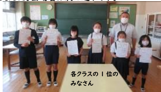
各クラスの1位のみなさん