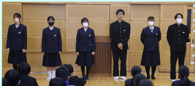
↑旧執行部 ↓新執行部・委員長

昨年の12月22日(金)終業式の後、生徒会執行部の交代式を行い、3年生の生徒会長から、新しい2年生の生徒会長へと執行部のバトンが渡されました。また、3学期始業式の後、新委員長の任命式が行われ、生徒会長より4名の委員長が任命され、代表して保健給食委員長より決意の言葉が全校生徒に告げられました。