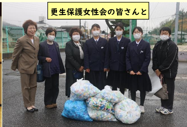
更生保護女性会の皆さんと