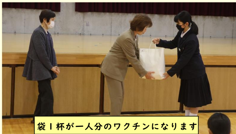
袋1杯が一人分のワクチンになります

府中地区更生保護女性会の方をお招きし、生徒会で1年間集めたエコキャップ(約24kg)をお渡しました。会長さんからエコキャップ運動の始まりからのお話を聞き、来年も集めるようにお願いされました。ペットボトルのキャップをそのまま捨てるのではなく、生徒を通して学校に届けてください。(洗ったものを直接学校にお持ちくださってもお預かりいたします。)