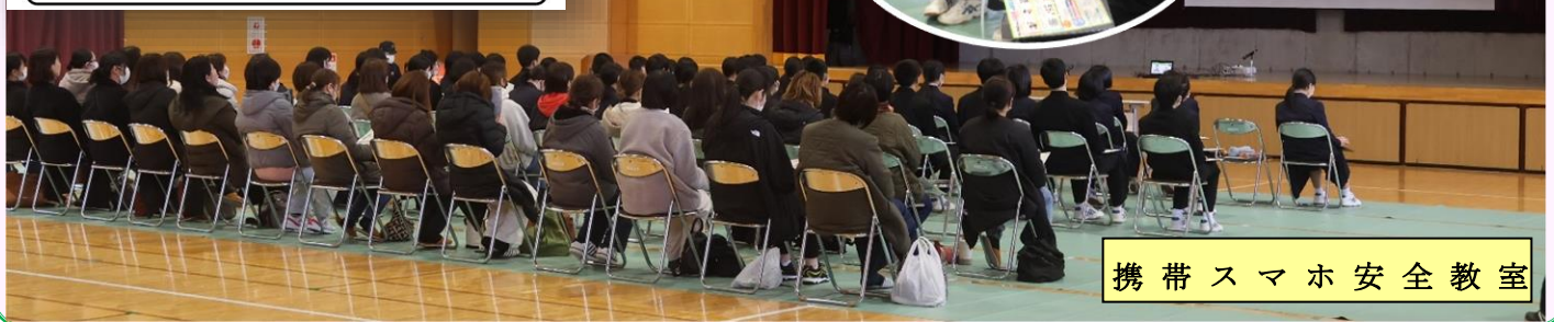
携帯スマホ安全教室